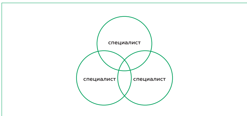
Рисунок 3. Междисциплинарное взаимодействие в команде

Во время каждой консультации все специалисты должны быть очень внимательны к тому, что делают их коллеги, и стараться учитывать полученные ими данные. Члены команды не могут транслировать родителям три версии, как будто бы они сидели в трех разных кабинетах. Также нельзя допустить, чтобы три специалиста три раза рассказывали примерно одно и то же, но разными словами. Начинаящей команде трудно представлять родителям обобщенные результаты. Чтобы избежать противоречий, можно выйти на несколько минут и согласовать результаты своих наблюдений и предлагаемые рекомендации. Общие соображения должен рассказывать один человек (ведущий), остальные могут его дополнить. Ведущим обычно становится психолог, но и другие члены команды могут быть ведущими.