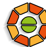
График проведения обучающих семинаров: