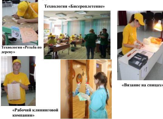
Технология «Резьба по дереву»

Региональный центр развития. Участие и победы в движении «Абилимпикс».