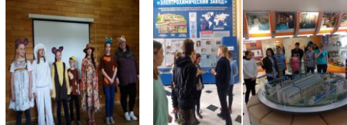
Экскурсия в МВЦ «Енисейская летопись»

Краевое общество инвалидов «Край света». Участие в Краевом фестивале «Театр на траве», диплом за 1 место