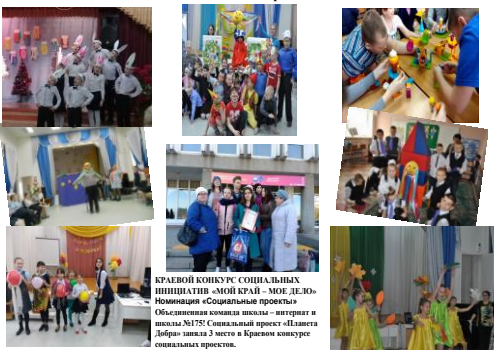
КРАЕВОЙ КОНКУРС СОЦИАЛЬНЫХ ИНИЦИАТИВ «МОЙ КРАЙ - МОЕ ДЕЛО» Инициатива «Социальные проекты» Объединенная команда школы - интернат и школы №178 (социальный проект «Планета Добра») заняла 2 место в Краевом конкурсе социальных проектов.

Социальный проект «Планета Добра» - сетевое взаимодействие школ и городских организаций по формированию толерантной среды к детям с ОВЗ в условиях города, способствующей их социализации и интеграции в общество как полноценных граждан.